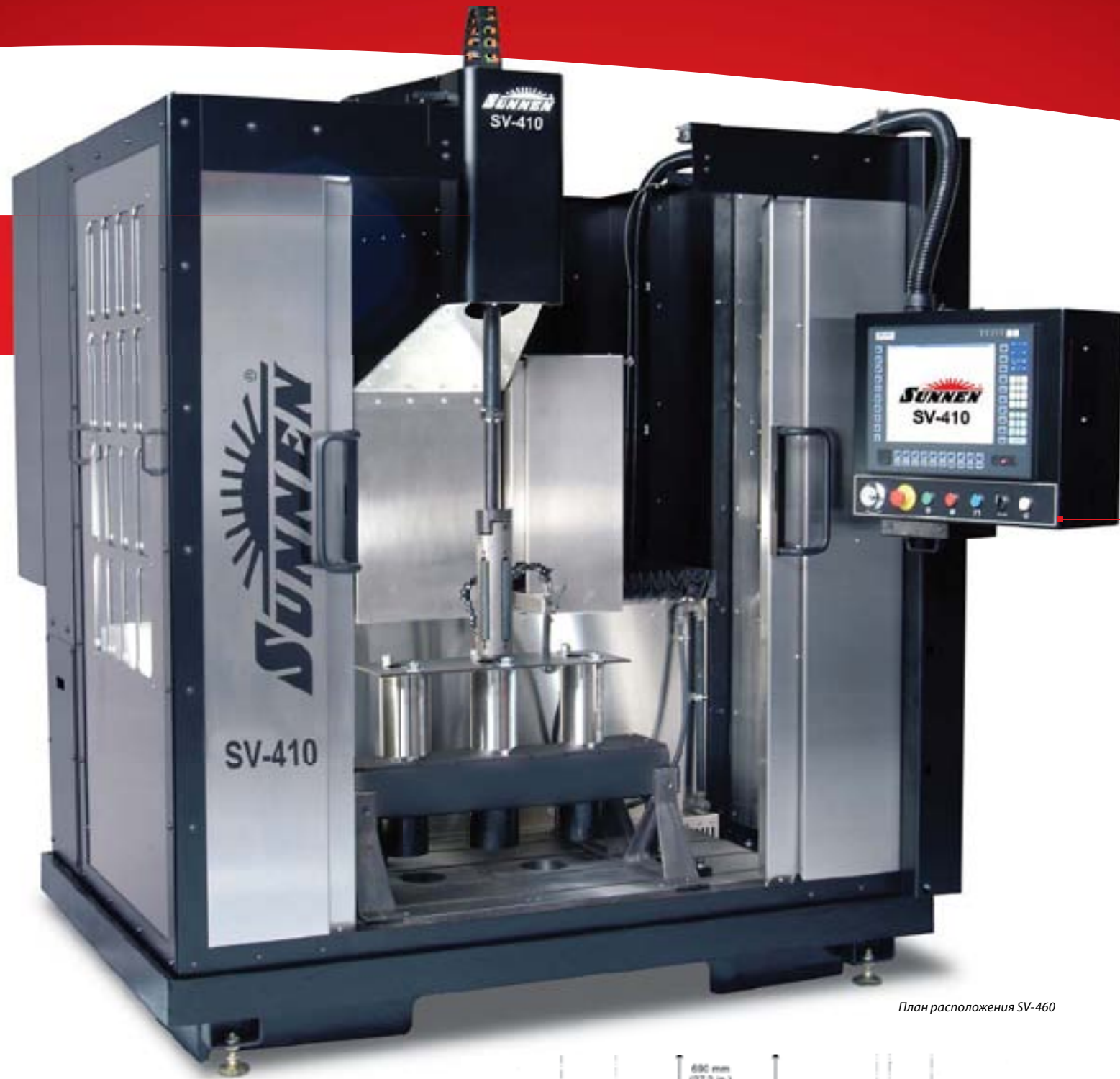
План расположения SV-460