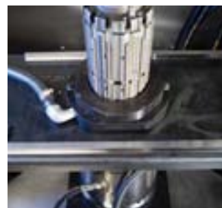
Контроль точности черновой и чистовой доводки. Встроенная система замера воздуха.