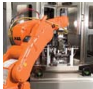
Двух- или многокоординатный серворобот может быть встроены в модульную систему.